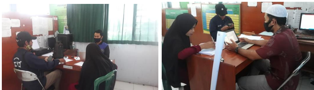
Gambar 1. Rapat Persaiapan Pelatihan Personal Branding Dan Literacy Digital

Kegiatan ini diawali dengan rapat persiapan Tim Pengabdian di ruang Program Studi Ekonomi Syariah Fakultas Ekonomi dan Bisnis Islam IAI Muhammadiyah Bima sebanyak dua kali. Pada Rapat persiapan pertama dipimpin oleh ketua Tim dengan agenda penyusunan surat, soal pre test dan post test , sertifikat peserta dan pemateri, cetak spanduk, kesiapan tempat dan sound systym dandan undangan untuk peserta perwakilan tingkatan. Pada rapat persiapan ke dua, dipimpin oleh Ketua Tim Pengabdian dengan agenda pemantapan persiapan, pembagian peran tim, kepastian kehadiran pemateri dan proses dokumentasi kegiatan termasuk absensi kehadiran peserta dan pemateri serta pembuatan grup whatsapp bagi peserta untuk mempermuah laju komunikasi. Penekanan pada rapat persiapan ke dua adalah pentingnya memberikan konten yang terbaik kepada peserta sehingga tujuan dan output kegiatan dapat tercapai secara maksimal.